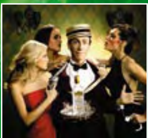
Магия гламура Тараса Маляревича