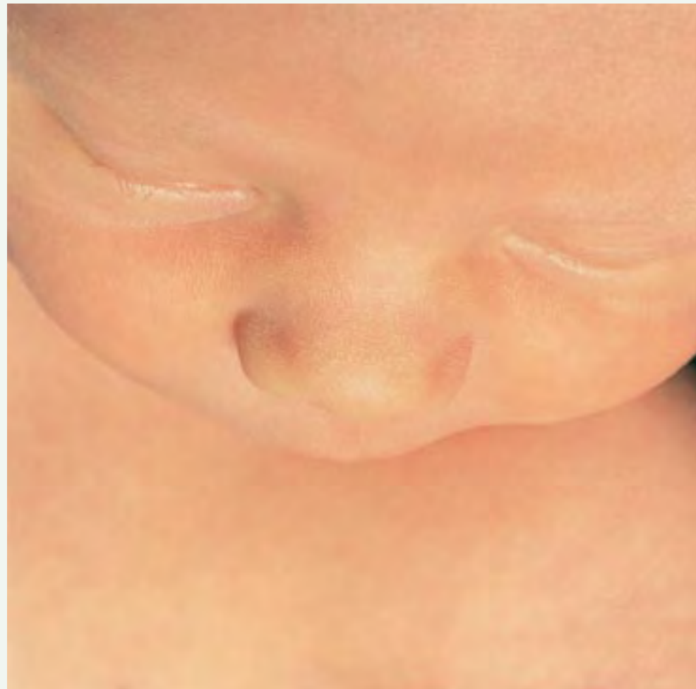
Малыш Великобритания, 2002