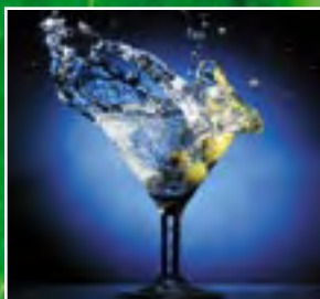
Практикум: снимаем бурю в бокале