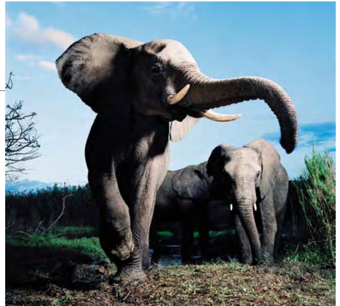
Марш слонов Южная Африка, 2003