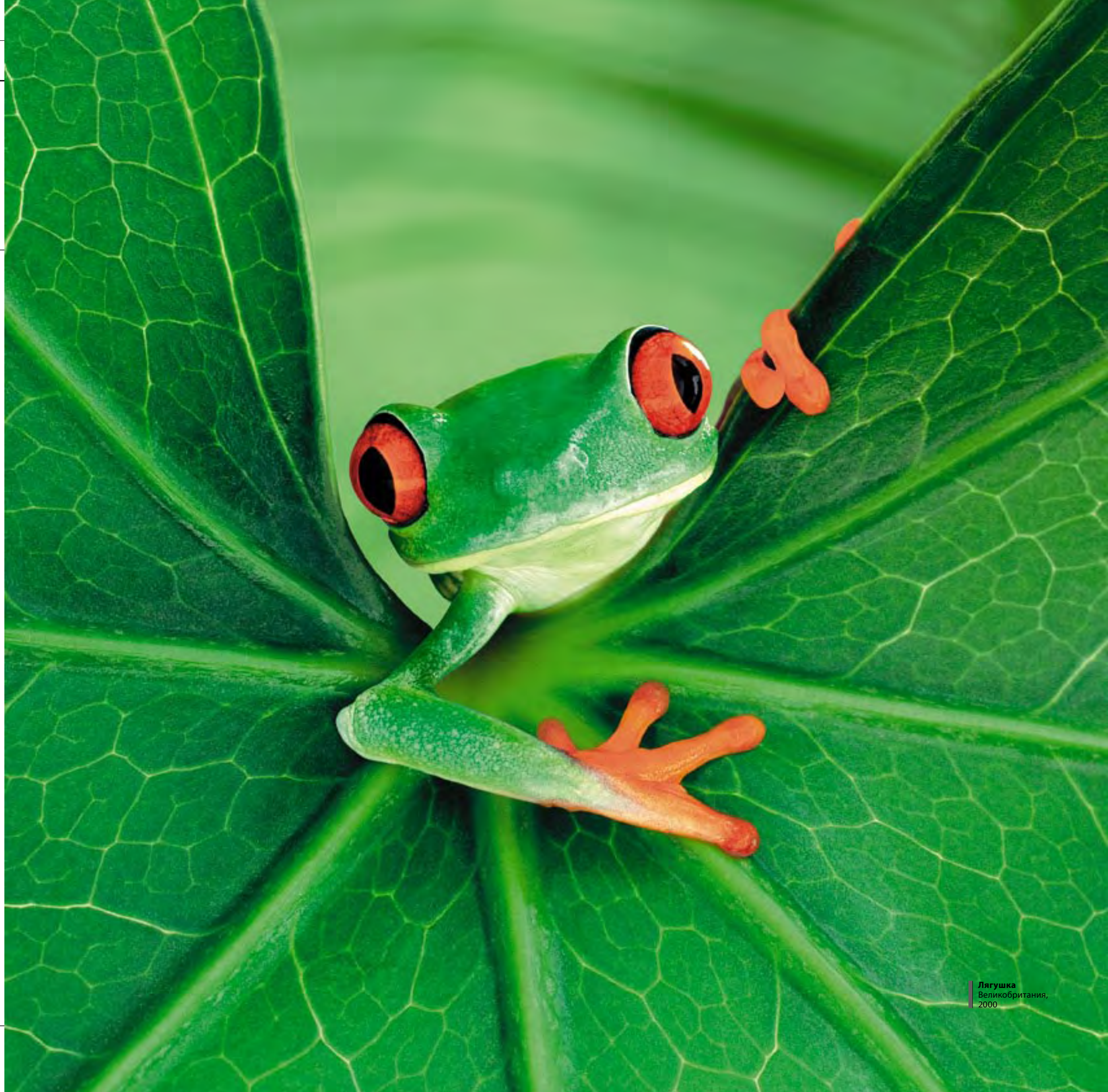
Лягушка Великобритания, 2000

Снимки этого автора вряд ли целесообразно использовать для иллюстрации учебников по зоологии. Тим Флэч отступает от привычного изображения животных — его работы скорее философские, чем документальные.