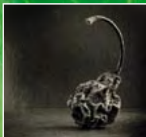
Финал весеннего dFOTO-Турнира