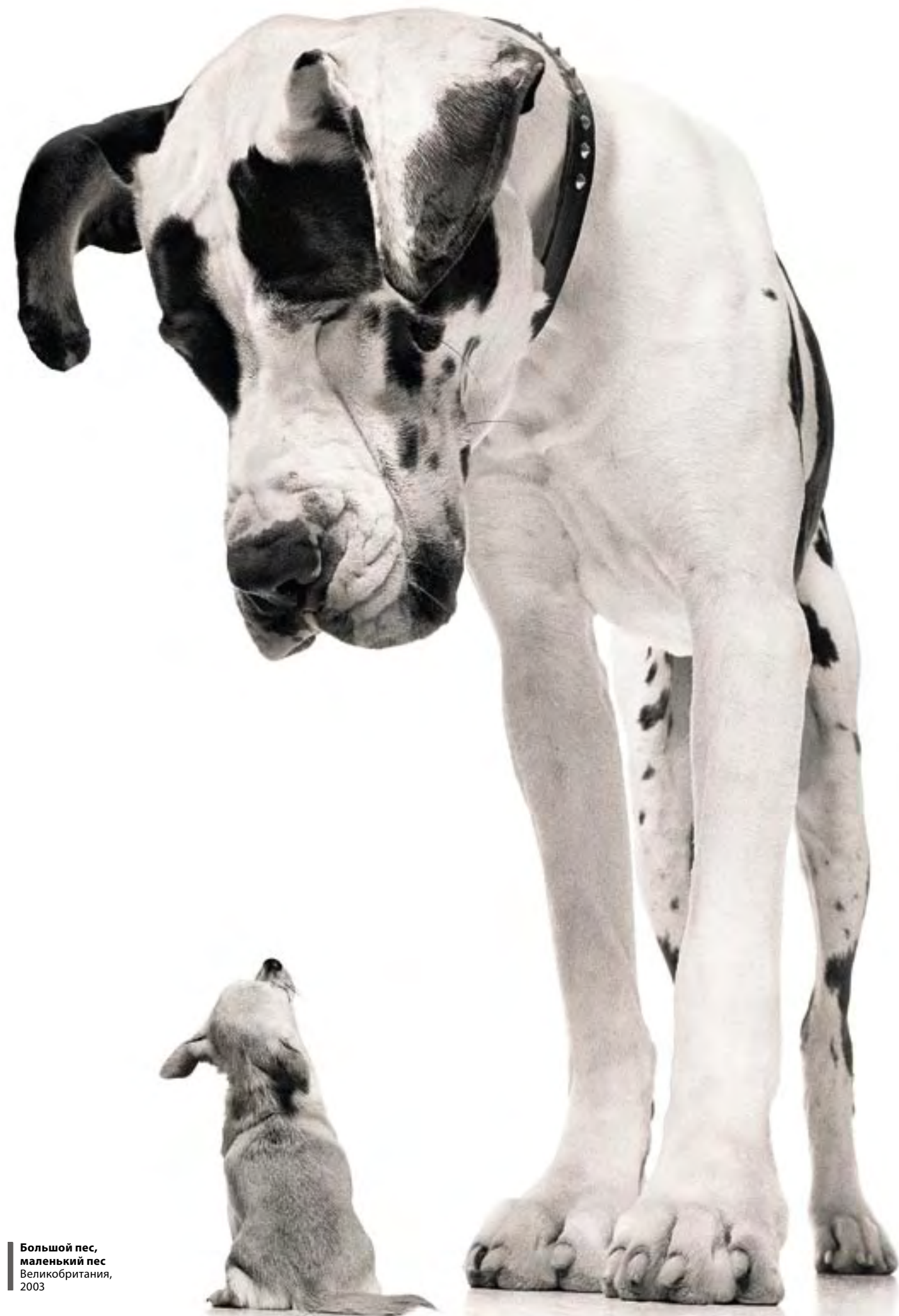
Большой пес, маленький пес Великобритания, 2003