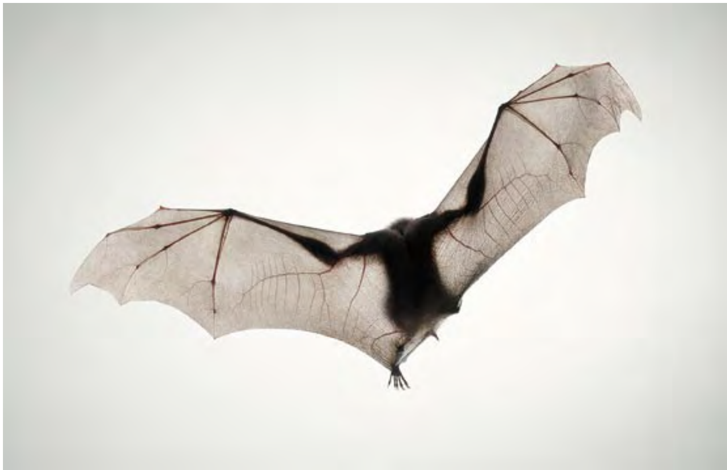
Летучая обезьяна Великобритания, 2006

Если у меня появляется свободное время, сразу перехожу к своим собственным проектам (сейчас, например, я снимаю лошадей). Это тоже всегда связано с путешествиями. Недавно я был в Индии и Монголии, с первым снегом собираюсь посетить Россию.