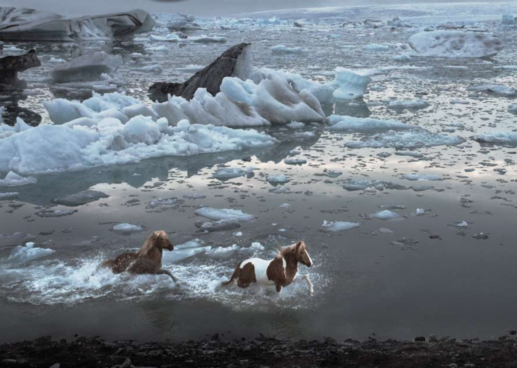
PHOTO magazine: Ați vorbit deseori în interviurile pe care le-ați acordat numeroaselor reviste de profil din întreaga lume despre valori emoționale. Cât de importante sunt acestea pentru d-voastră?

Tim Flach: Cred că trebuie să mă explic puțin. Un fotograf trebuie să exploreze de ce un anumit